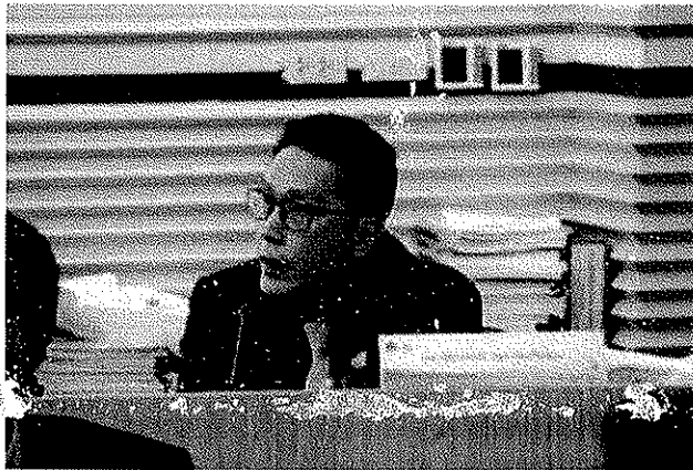
การประชุมสภาคณะผู้บริหารบัณฑิตวิทยาลัยศึกษาแห่งประเทศไทย (สคบท.) ครั้งที่ 4/2562 วันศุกร์ที่ 6 ธันวาคม 2562 เวลา 13.00 น. ณ ห้องประชุมท้อแก้ว สำนักงานอธิการบดี มหาวิทยาลัยราชภัฏนครศรีธรรมราช