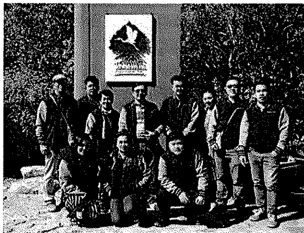
คณาจารย์และบุคลากรถ่ายภาพหมู่พื้นที่แหล่งเรียนรู้เพื่อนำองค์ความรู้ไปประยุกต์ใช้ในการบริหารจัดการบัณฑิตวิทยาลัย